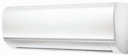
Внутренний блок KSGYK21HZRN1